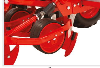
Küçük Tohumlar için Ön Baskı Tekeri