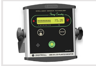
Digitroll DMS-08 Sensör