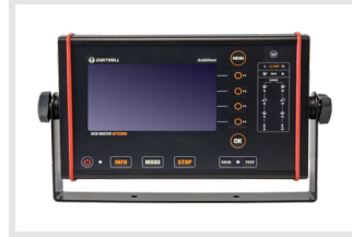
Digitroll Integra Sensör