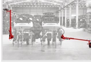
Opsiyonel Çift Pistonlu Markör