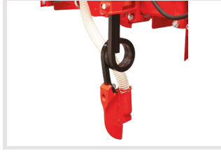
Balta Tip Gübre Atıcı