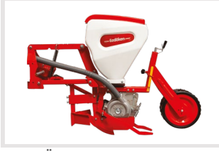
Balta Tip Ünite