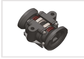
Uzun Ömürlü Yatak