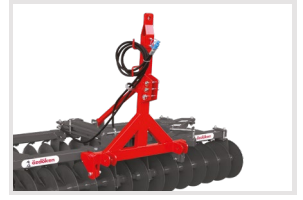
Hem Çekili Hem Hidrolikli Kullanım