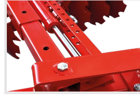
Hidrolik Kumanda İle Açı Verebilme