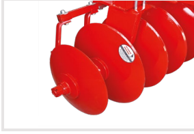
Çizi Çukuru Kapatıcı