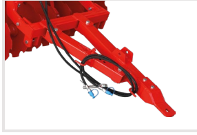
Ayarlanabilir Ok Tertibatı