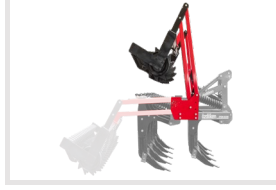
Pistonlu Katlamalı Mordane Makine üzerindeki piston sayesinde merdaneyi kolayca katlayabilirsiniz.