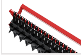
Dolu Mordane - 270 mm