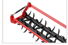
Çiftli 140 mm Dolu Mordane