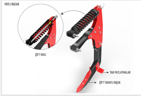
Çelik Döküm Bacak