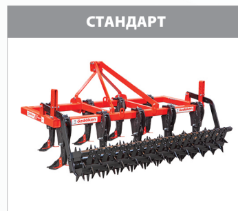
ОДИНАРНЫЙ КАТОК Одинарный ролик помогает подготовить семенную почву. Также это помогает работать на оптимальной рабочей глубине.