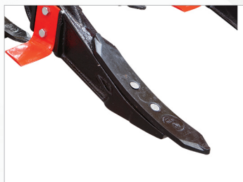
РЕВЕРСИВНОЕ ЛЕЗВИЕ Реверсивное лезвие, изготовленное из борной стали для обеспечения долговечности и длительного срока службы.