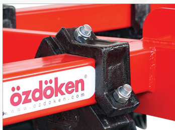
ЧУГУННЫЕ НОГИ С ЗАЩИТНЫМ ПИН-КОД